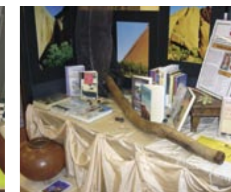
Tentoonstelling in het kader van de "Keuze van de medewerker"