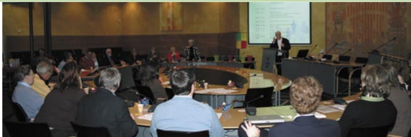
Bijeenkomst voor het algemene publiek over de toekomst van de bibliotheek in de Raadszaal in Voorburg op 29 maart 2006