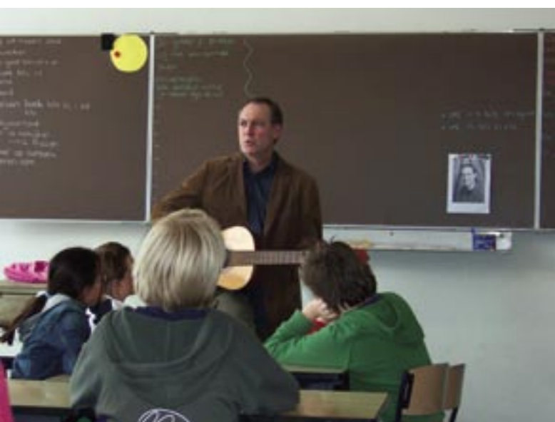
Op 9 november gaf filosoof, schrijver en televisiemaker Bas Haring een lezing in locatie Leidschendam