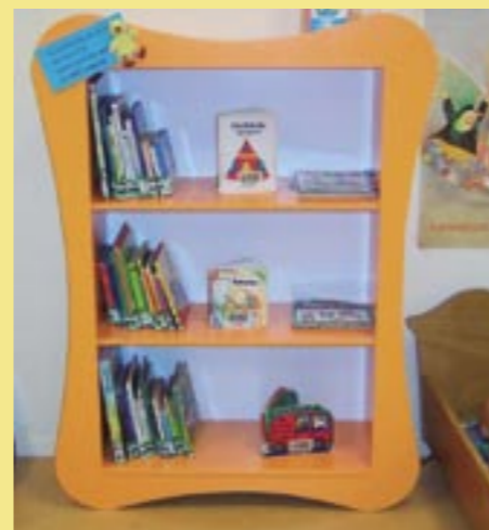
Eén van de boekenkastjes die geplaatst zijn in de consultatiebureaus van stichting Florence in het kader van het stimuleren van (voor)lezen.

dat daar projectcollecties van de bibliotheek aanwezig zijn. Dankzij de actie die uit deze samenwerking volgde in juni, werden 18 nieuwe jeugdleden ingeschreven.