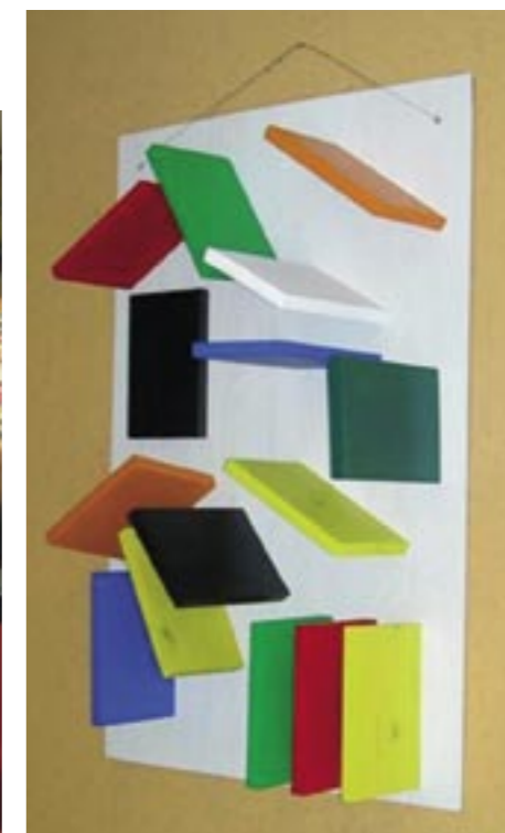
Expositie in locatie Leidschendam van cliënten van de dagbehandeling van WZH Prinsenhof