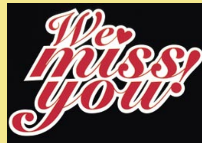
"We miss you" stond op de kaart die aan 450 jongeren werd gestuurd om ze weer in de bibliotheek te krijgen

De regiowerkgroep marketing heeft in 2006 een marktanalyse laten uitvoeren van de regiobibliotheken en -gemeenten. Dit had als doel om erachter te komen op welke zaken de bibliotheken gezamenlijk marketingbeleid kunnen voeren. In 2007 zal op basis hiervan een concreet marketingplan ontwikkeld worden voor een regionaal aanbod van culturele en educatieve activiteiten.